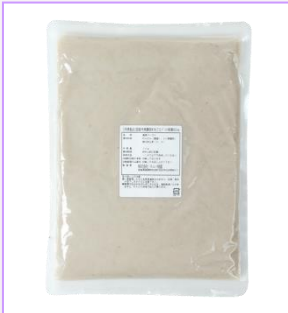
7. 冷凍蓮根まるごとペースト 無漂白