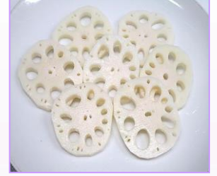
3. 国産 水煮蓮根スライス