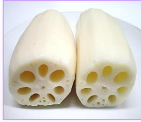
1. 国産 水煮蓮根ホール