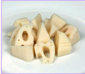
4. 国産 水煮蓮根乱切