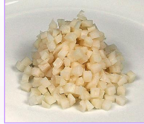
2. 国産 水煮蓮根ダイスカット